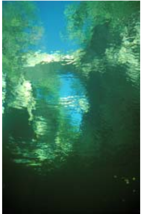
Cannobina, 1997, P. Hefti

Nun hoffen wir, dass ihr euch möglichst zahlreich anmeldet. Es lohnt sich!